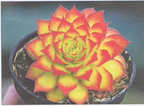
Sempervivum 'Chick Charms Gold Nugget'.

Im Staudenbereich empfiehlt Plantipp für 2019 den pflegeleichten Ajuga 'Princess Nadia'. Er blühe üppig und mehrfach im Jahr.