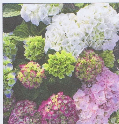
Quattro: vier Farben vereint in ei-