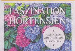
Das Cover des Buches PELLENS

114 Seiten mit vielen Tipps und Hinweisen