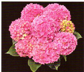
Gefüllt: 'Double Pink'